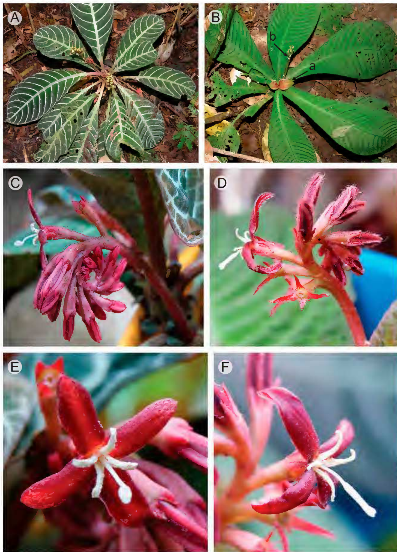
Fig. 2. A, C, E. Hoffmannia discolor (Lem.) Hemsl., B, D, F, Hoffmannia rzedowskiana Cast.-Campos, Bautista-Bello y Lorence. A. hábito, mostrando hojas con nervaduras de color blanco-metálico en el haz, pecíolos de color rosa o rojo claro y el arreglo de los frutos en la infrutescencia; B. hábito, mostrando hojas con nervaduras y sin pecíolos, hojas jóvenes de color rojo claro (a) y la infrutescencia con frutos inmaduros (b). C, D. inflorescencia; E. flor con estigma capitado; F. flor con estigma linear.